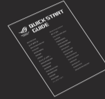
1 x User documentation